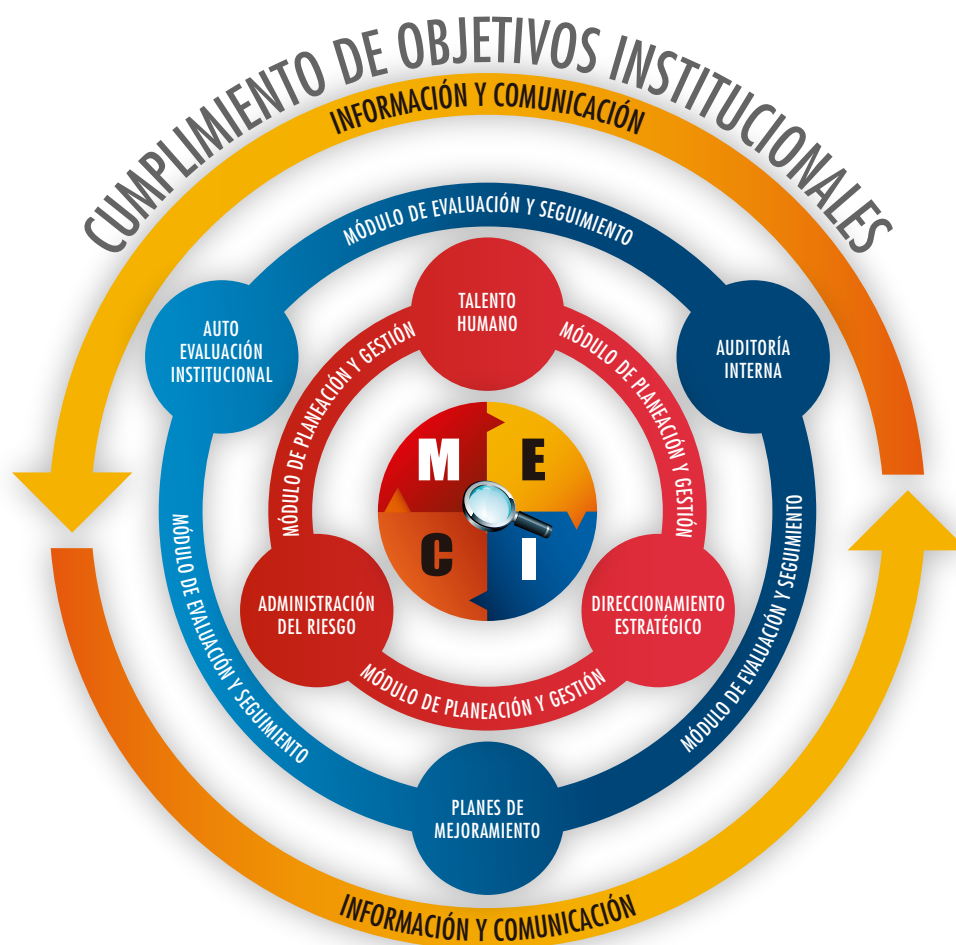
Ilustración 1. Estructura del Modelo Estándar de Control Interno

El gráfico que a continuación se muestra permite observar la estructura del MECI: